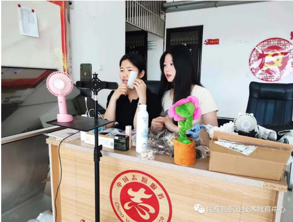
10 电商专业学生直播技术培训现场