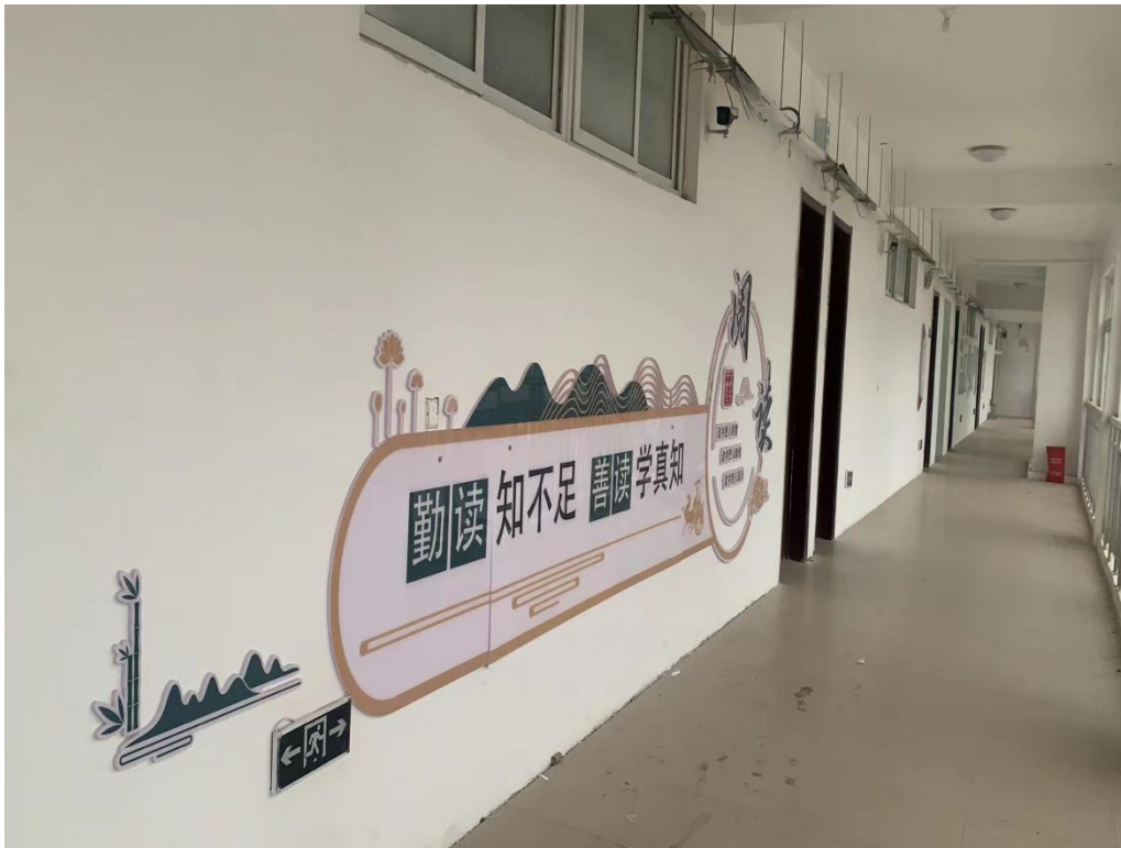
2 学校教室文化走廊

开辟文化墙，使学生亲自参与自学熏陶；建成完善的校园电化教学网络，普及文明新风；在学校重点部位张贴名言，出优秀毕业生展板，展示学校校训和育人理念，提升校园文化层次。每周一举行的升旗仪式、国旗下的讲话，重大节日的庆祝、纪念活动，让校园文化丰富多彩。