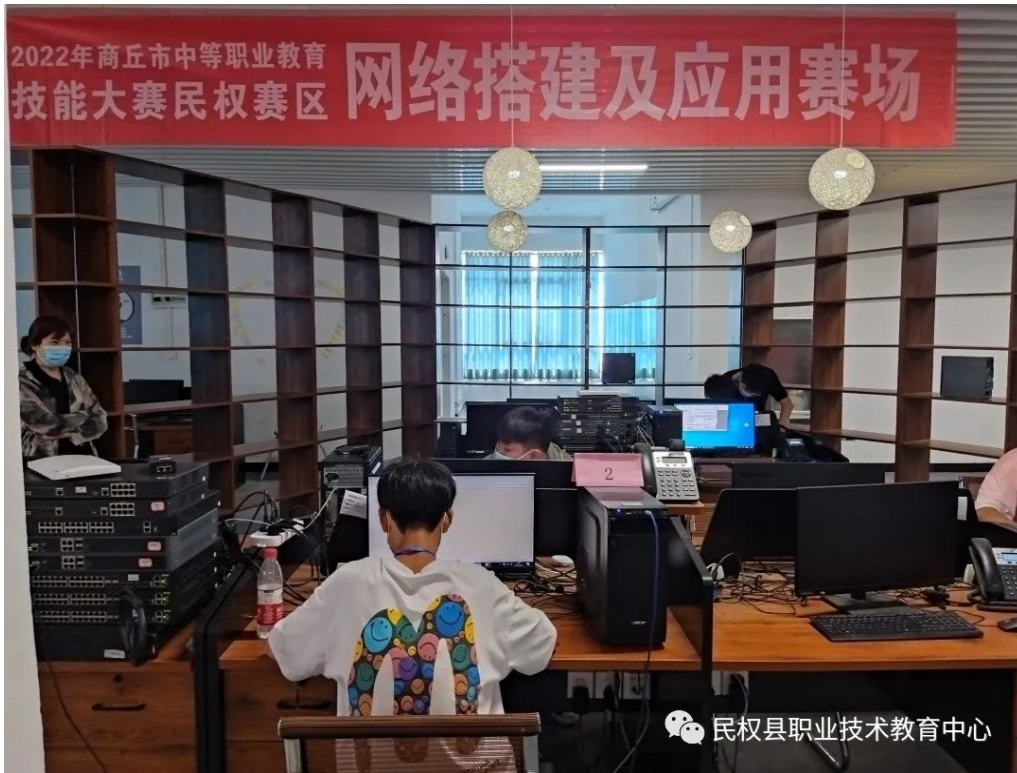
5 2022年商丘市技能大赛民权赛区赛场