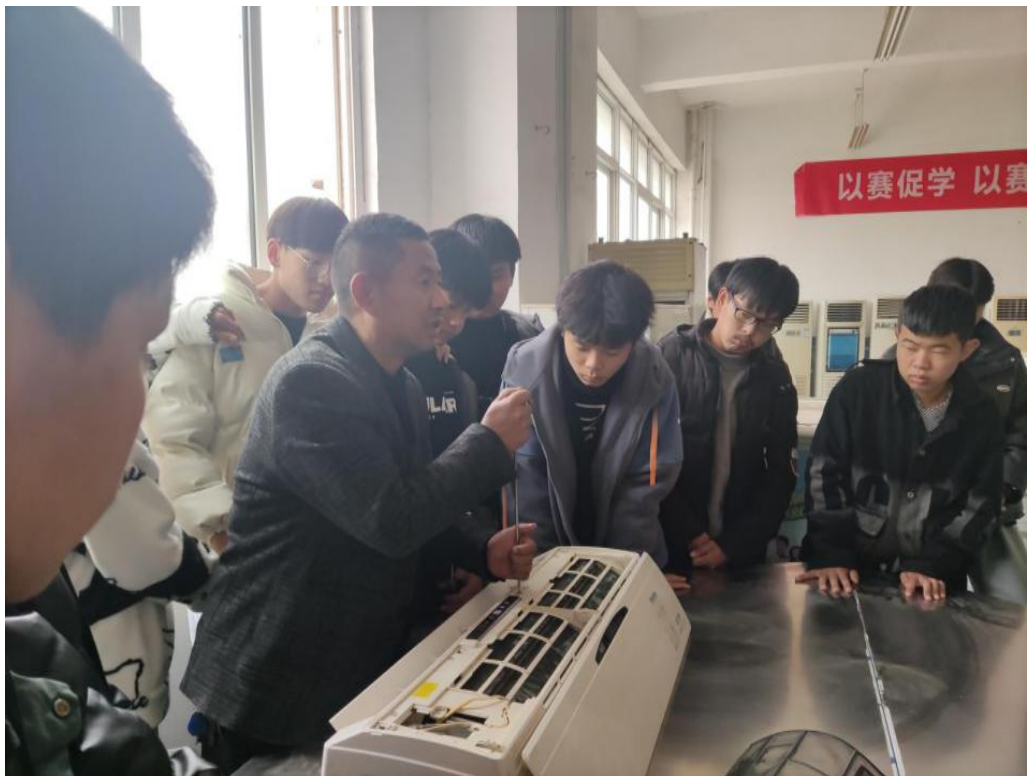
6 制冷专业老师现场教学

过程性评价，定量评价与定性评价相结合，由总结性评价向诊断性评价转移；借鉴专业技能评价模式，以任务为引领，以活动为载体，开展公共基础能力竞赛；将学生综合素质分解实施考核且落实到教学全程，实现学生成绩考核综合化，发挥监控、考核、评价的反馈功能，强化对评价结果的调节与激励。