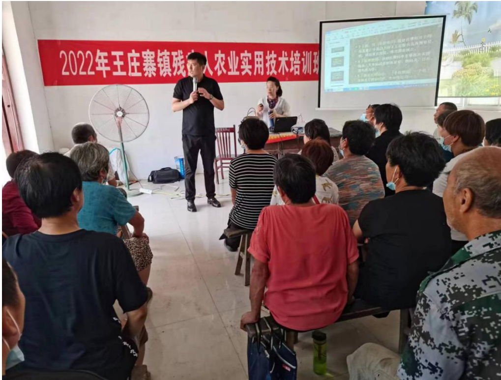
9 残疾人农业实用技术培训现场

学校设有培训中心，承担全县农村劳动力转移培训、下岗再就业培训、特种作业人员培训、移民培训等培训任务。2021 学年，学校以电子商务、计算机等专业为依托，开办短训班 9 期，共培训 1094 人次。