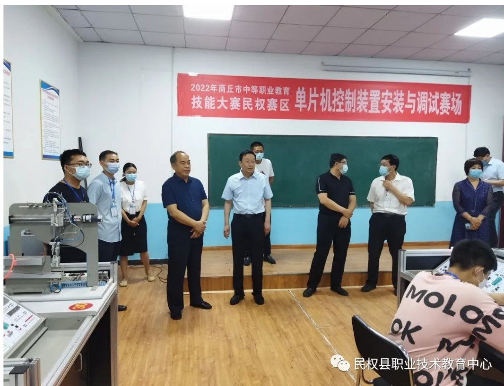
4 2022年商丘市技能大赛民权赛区赛场