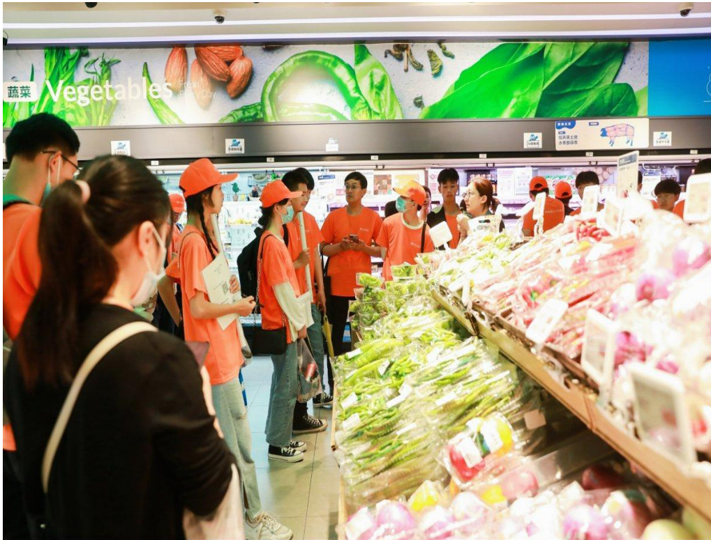
8 电商专业指导教师及学生在企业游学

学校主动融入职教大环境，充分发挥品牌专业和特色专业的优势，联合县政府和行业企业，结合本地行业的特点和优势，积极组建或参与职教联合办学，为区域经济建设服务，在政府主导下，由学校牵头，联合河南澳柯玛电器科技有限公司、河南万宝制冷有限公司、香雪海家电有限公司组建制冷电器职教集团；全力做好与集团内高职院校的衔接、与企业行业单位的对接、实现了资源共享，合作共赢。